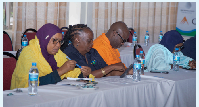
Wajumbe na wanachama wa TATC wakifuatilia majadiliano wakati wa Mkutano Mkuu wa Mwaka uliofanyika jijini Arusha.

Mkutano Mkuu wa Mwaka wa TATC umefanyika kwa siku tatu, huku Alpha Associates Tanzania Limited ikiwa miongoni mwa wadhamini wa mkutano huo kwa mwaka 2026. Kampuni hii imeendelea kutoa mchango mkubwa katika kuhudumia jamii kupitia elimu ya kodi na usimamizi wa biashara kwa zaidi ya miaka 25.