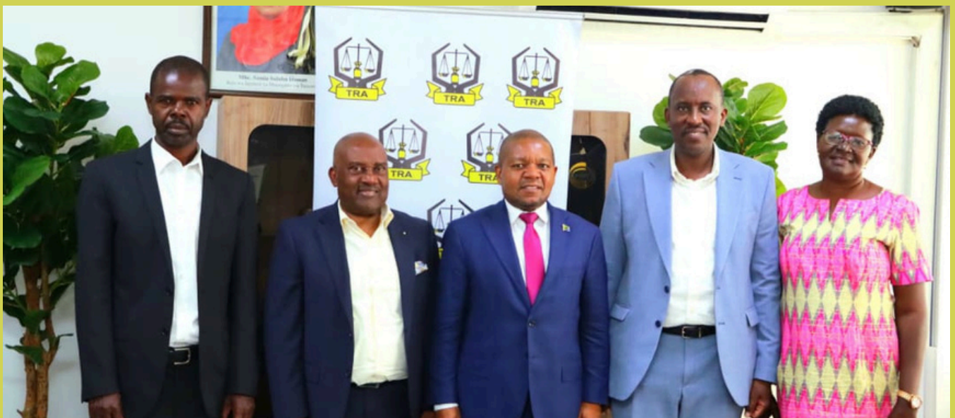
Viongozi wa TRA na URA wakiwa katika picha ya pamoja mara baada ya kikao cha ushirikiano kilichofanyika jijini Dar es Salaam.