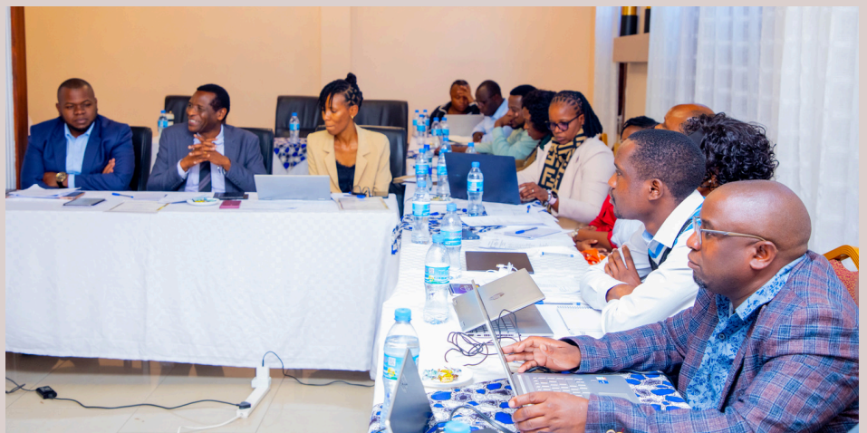
Wajumbe wa Kamati ya Ushauri ya NM-AIST katika kikao maalum kilichofanyika jijini Arusha tarehe 25 Machi 2026.